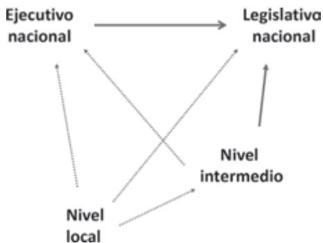
Gráfico 1: Negociación intergubernamental a través del legislativo nacional

de subordinación 10 entre los diferentes niveles sub-nacionales. Empero, en los países de origen unitario, ningún nivel sub-nacional de gobierno tiene representación territorial en el poder legislativo, inclusive cuando un país cuenta con un Senado. Es por ello que una variante que debe ser internalizada en el modelo es aquella donde se toma en cuenta, además de los intereses partidarios, los intereses territoriales (y no la representación de las unidades territoriales) de los legisladores. En otras palabras, a falta de representación territorial directa, los niveles sub-nacionales de gobierno tratarán de verse representados a través de los intereses territoriales de los legisladores. El gráfico 1 muestra la primera configuración posible de negociación intergubernamental, donde los niveles de gobierno confluyen y ejercen influencia sobre el poder legislativo nacional como espacio de negociación principal.