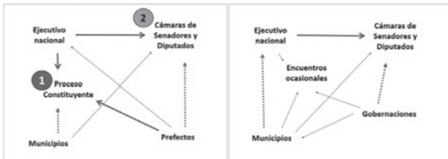
Gráfico 5: Instancias de negociación en el proceso constituyente y normas posteriores