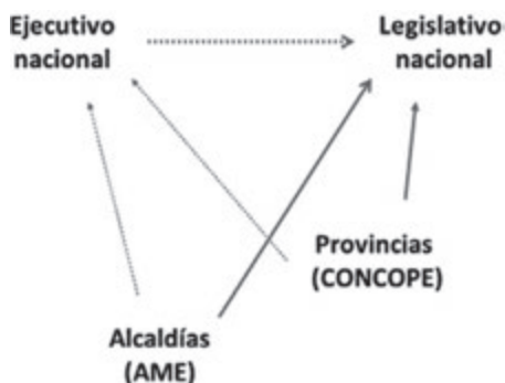
Gráfico 7: Instancias de negociación de la Ley del 15%

El 15% y el posterior estancamiento del proceso: 1996-2006. Una vez más, las negociaciones que conducen a la reforma más importante del periodo 1996-2006 se producen en el congreso nacional. Tanto la reforma constitucional de 1996 como la promulgación de la Ley del 15% en 1997 suceden en esta ocasión en escenarios con escaso poder del ejecutivo central.