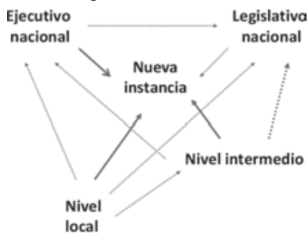
Gráfico 2: Negociación intergubernamental a través de escenarios ad hoc

En este caso ad hoc , un supuesto perdedor podría resultar siendo el poder legislativo nacional, puesto que de ser el escenario privilegiado de negociación pasaría a ser un actor más. Sin embargo, no hay que desdeñar el poder de veto del legislativo. Si los acuerdos intergubernamentales generados en estos escenarios alternativos de negociación requieren de leyes, éstas deben de todas maneras ser sancionadas por el poder legislativo del nivel nacional para su implementación.