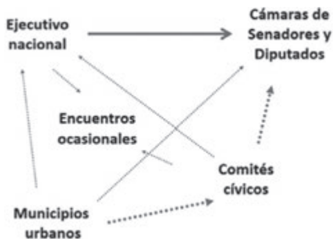
Gráfico 3: Instancias de negociación de la LPP y la LDA

En el periodo de preparación y discusión de la LPP, los municipios, que solo existían en las zonas urbanas, tuvieron poco poder de negociación, eran débiles y no trascendentes (Molina, 1997a); además de que carecían de una estrategia de desarrollo a largo plazo, en parte por la división política entre sus representantes (The World Bank, 1994). En cambio, los lobbies regionales, con mayor coordinación e historia que las fuerzas locales, forzaron otro tipo de escenarios y negociaciones extra-legislativas (Gráfico 3), viendo que los intereses territoriales en el poder legislativo eran muy débiles con respecto a los intereses partidarios. El resultado en este periodo fue de descentralizar por la vía local y no por la regional, una postura del nivel central que respondió a los temores de que las regiones fuertes contestasen su poder (Grindle, 2000).